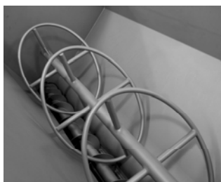
Agitador opcional de produto evita o recongelamento