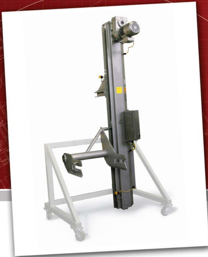
Vista con base portatile opzionale